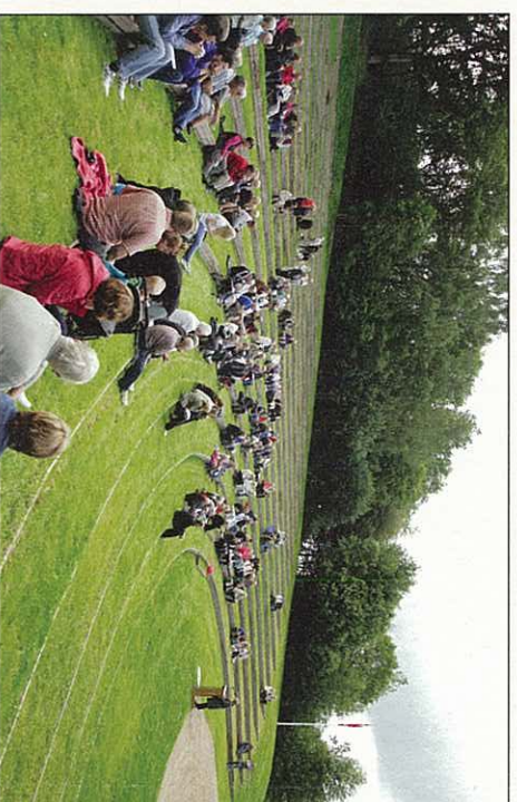
Amfiscenens indvielse i 2009.

Amfiscenen der blev indviet i 2009 er blevet til i et samarbejde mellem Miljøministeriet ved Skov- og Naturstyrelsen, Assens Kommune, den selvejende institution Frøbjerg Bavnehøjs Amfiteater, foreningen Frøbjerg Festsplil, samt andre lokale foreninger, fonde, banker og private.