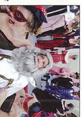
Festsplillene på Frøbjerg Bavnehøj. Her fra "Mød mig på Cassiopeia".

Hvert år i spiller Frøbjerg Festsplil friluftsteater på festpladsen. Siden første forestilling i 1986, har festsplillene hvert år trukket op mod 25.000 glade fynboer ud i naturen for at opleve friluftsteater.